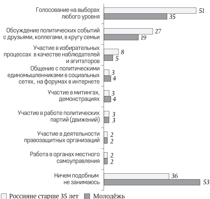
Рис. 1. Участие российской молодёжи в разных формах политической жизни, %