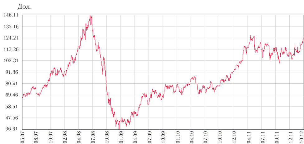
Рис. 2. Динамика спотовых цен на нефть марки "Brent" на Лондонской бирже в мае 2007 – феврале 2012 г. (Нефть России : информ.-аналит. портал. URL: http://www.oilru.com/dynamic.phtml ; дата обращения: 15.04.2012)

Волатильность цен на нефть на Лондонской бирже в последние годы наглядно демонстрирует рис. 2. Развитие кризиса в Ливии и Египте заставило потребителей и поставщиков нервничать из-за возможных перебоев в танкерных перевозках сжиженного природного газа, нефти и нефтепродуктов через Суэцкий канал. Они опасались, что кризис распространится и на другие ближневосточные страны – экспортёры углеводородных ресурсов, включая даже Саудовскую Аравию (в самых алармистских сценариях). Кроме того, в конце 2011 – начале 2012 г. заметно выросли политические риски из-за тревожного развития ситуации в Ормузском проливе и введения США и Евросоюзом дополнительных санкций против Ирана. На фоне этих событий в феврале 2012 г. произошёл очередной скачок цен (почти на 10 дол.).