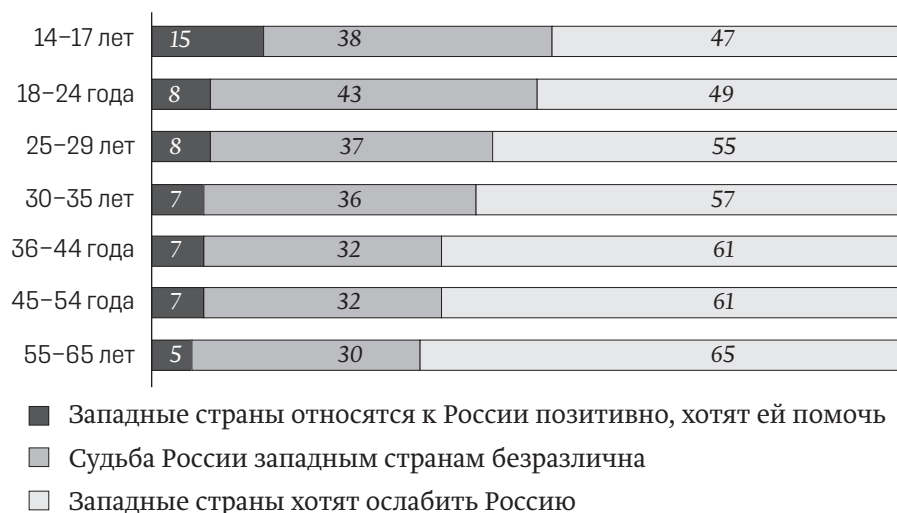
Рис. 2. Представления россиян об отношении западных стран к России, 2021 г., %

Важно отметить, что доминировавшую в 1990-е гг. иллюзию о позитивных намерениях Запада в отношении России (тезис «Запад хочет нам помочь») сохраняли не более 15 % подростков 14–17 лет, а в средних и старших возрастах таковых и вовсе оказалось около 5–7 % (рис. 2). Устремления Запада на российском направлении оценивались молодёжью в возрасте от 14 до 35 лет как недружественные, нацеленные на ослабление России, установление над ней контроля, обеспечение зависимости от его воли и влияния. Такое мнение разделяли 53 % представителей этой части населения, а среди россиян 36–65 лет – 62 %. Кроме того, значительная доля опрошенных из этих групп придерживалась мнения о том, что Западу абсолютно безразлична судьба России, поскольку он ориентирован исключительно на собственные интересы (39 и 31 % соответственно).