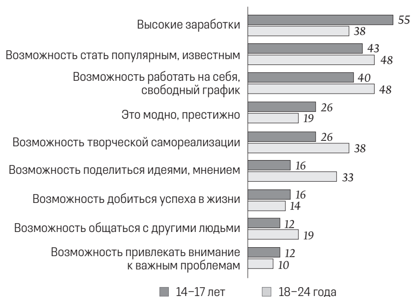
Рис. 4. Представления россиян в возрасте от 14 до 24 лет о ключевых преимуществах блогерской деятельности, 2021 г., %